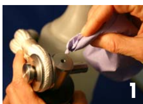
Rimuovere il grasso

Nel caso doveste montare il grillo tessile, seguite le istruzioni descritte qui sotto: