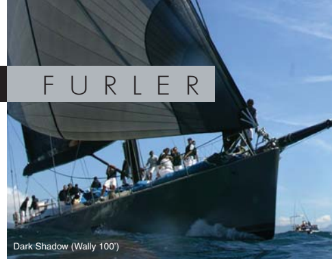
Dark Shadow (Wally 100)

Dank einer cleveren Innovation, kann die Endlosleine schnell und ohne Komplikationen entnommen werden. Diese besondere Eigenschaft hat den Vorteil, daß die Reffleine für den weiteren Gebrauch an Deck bleibt. Es ist nicht nötig die Fallenstopper zu öffnen, nur den Furler und das aufgerollte Segel abnehmen.